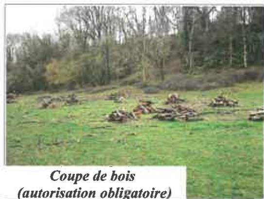
Coupe de bois (autorisation obligatoire)